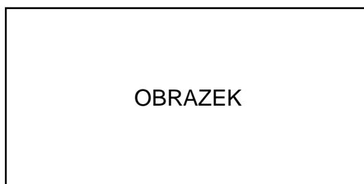
Rysunek 2 Ceny paliw na stacjach

Czy można spodziewać się podobnego scenariusza w Polsce? Prezes Orlenu Daniel Obajtek wielokrotnie krytykował działania Węgier. "Katastrofa paliwowa na Węgrzech to efekt zbytnej ingerencji w zasady wolnego rynku. Teraz brakuje tam paliw i jest drożej niż na polskich stacjach. Ostrzegałem przed takim scenariuszem, kiedy politycy opozycji nawoływali, by ceny paliwa sztucznie obniżyć" – pisał wówczas na Twitterze 2 .